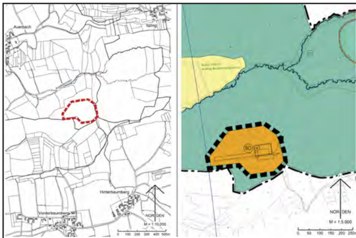
Ausschnitte aus den Planunterlagen des Marktes Wartenberg

Für die Realisierung der Windenergieanlage ist die Änderung des Flächennutzungsplanes erforderlich, da der geplante Standort die erleichterten Bedingungen für eine Privilegierung im Außenbereich nicht erfüllt. Zunächst war auch die Aufstellung eines Bebauungsplanes angedacht. Aufgrund der geltenden und kommenden Regelungen (§ 2 Nr. 1 lit. b) Windenergiebedarfsgesetz, Art. 82, 82a, 82b Bayerische Bauordnung, §§ 35, 249 Baugesetzbuch) erscheint die alleinige Änderung des Flächennutzungsplanes dem beauftragten Planungsbüro jedoch ausreichend, um die planungsrechtlichen Voraussetzungen für die Errichtung einer Windenergieanlage zu schaffen.