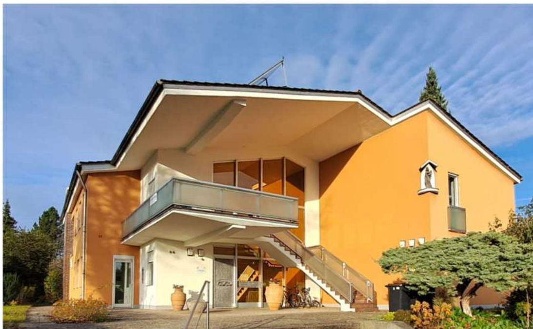
Erziehungsbearbeitungsstelle in der Freisinger Straße 44, 85435 Erding